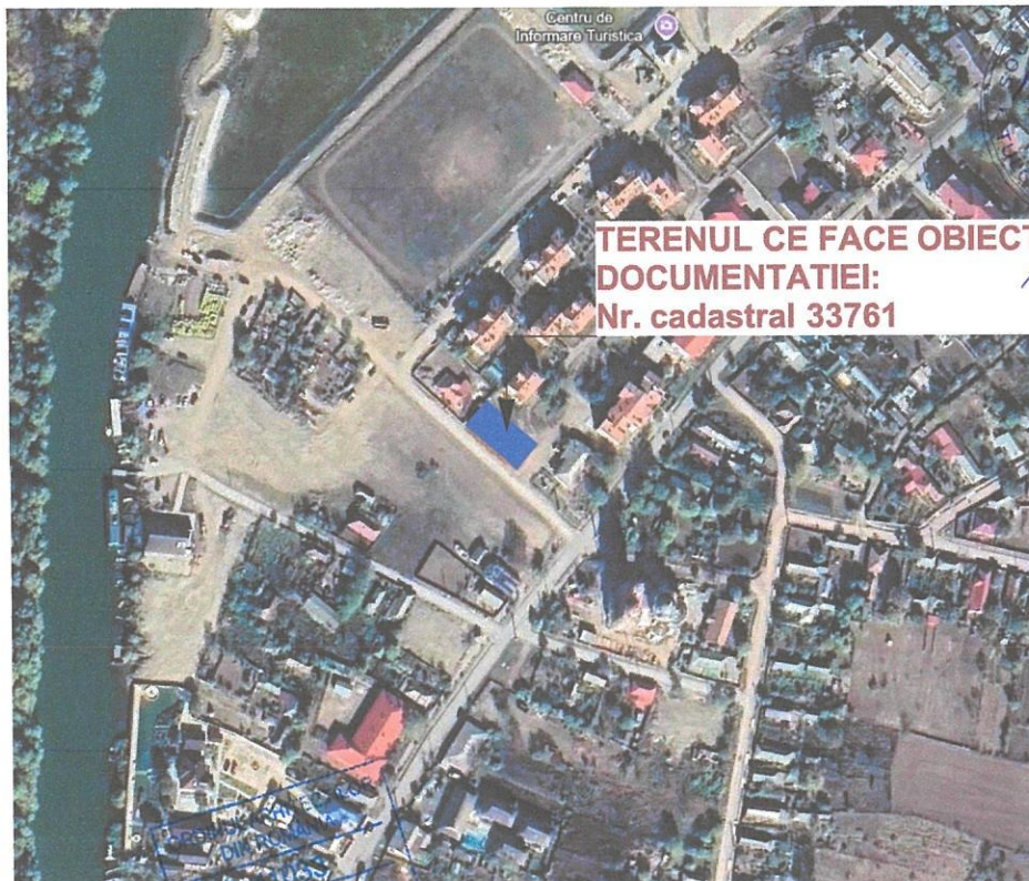
PLAN DE ÎNCADRARE CONFORM GOOGLE MAPS